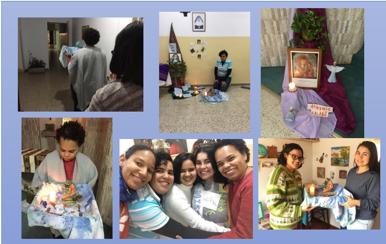
Comunidad del Noviciado Internacional Madre Cándida Córdoba – Argentina