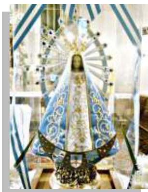
Nuestra Sra. de Luján Patrona de Argentina, Paraguay y Uruguay

Sería oportuno acudir a la galería de las diversas advocaciones de María como en muchos pueblos se le venera en este mes de mayo y nos demuestra cómo su amor llega al auxilio y consuelo de sus hijas e hijos, así ellos estén en los lugares más remotos del mundo. María en cada una de sus