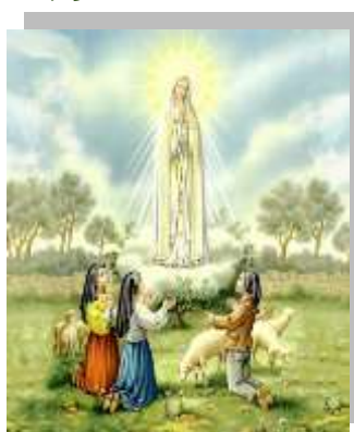
Virgen de Fátima

Sería oportuno acudir a la galería de las diversas advocaciones de María como en muchos pueblos se le venera en este mes de mayo y nos demuestra cómo su amor llega al auxilio y consuelo de sus hijas e hijos, así ellos estén en los lugares más remotos del mundo. María en cada una de sus