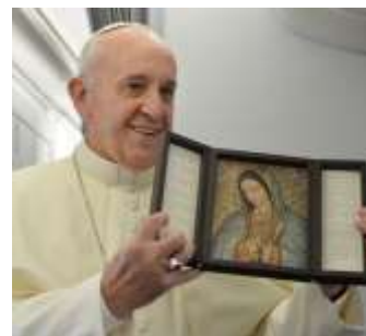
Mater Purísima, Nuestra Señora de las Mercedes... en fin...

comunidades se siguen esforzando por inculcar en las, los niños y jóvenes esta devoción a María como mujer del pueblo creyente, Reina de la Paz, la Inmaculada,