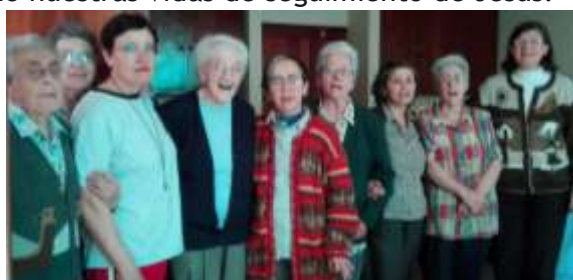
HH en la Casa Provincial

En la Casa Provincial celebramos con una rica comida al mediodía que, finalizamos cantando el himno de San Ignacio, en español y en vasco; y luego, las hermanas que quedamos en casa porque no podíamos ir a la Compañía, con unas vísperas muy sentidas y rezando con Ignacio.