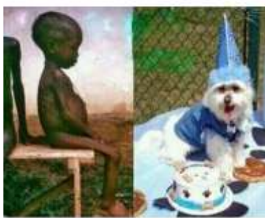
Algo estamos haciendo mal...