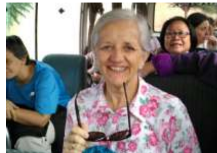
Hermanas de la Casa Provincial